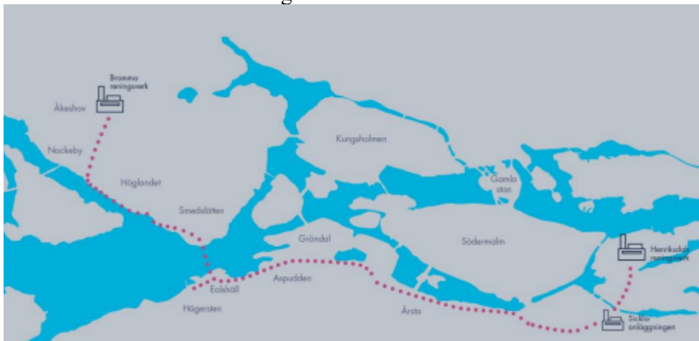
Bild 1 Tunneln från Bromma till Sickla

Tunneln mellan Bromma och Sickla är 14 kilometer och går så djupt som 90 meter i Mälaren. Betongarbeten pågår och installationer i tunneln är påbörjade. Tunneldrivningssarbeten av huvudtunnlarna är färdigställda. Den prickade linjen i bilden nedan visar tunnelns sträckning.